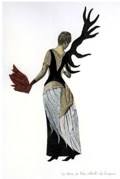
La dame au bois volant, encre de Chine et collage, de Fabienne Cinquin (2016).

L'artiste et illustratrice Fabienne Cinquin investit le musée Mandet avec ses « Muses et merveilles » jusqu'au 25 avril 2021. Un univers teinté de surréalisme qui met en lumière les peintures et sculptures du XVI e au XIX e siècle et autres objets d'art décoratif hébergés dans ce discret musée auvergnat. www.rlv.eu Ludovic Bischoff