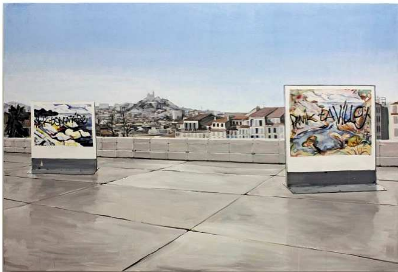
Paysages de Marseille, peinture de Guillaume Pelly.